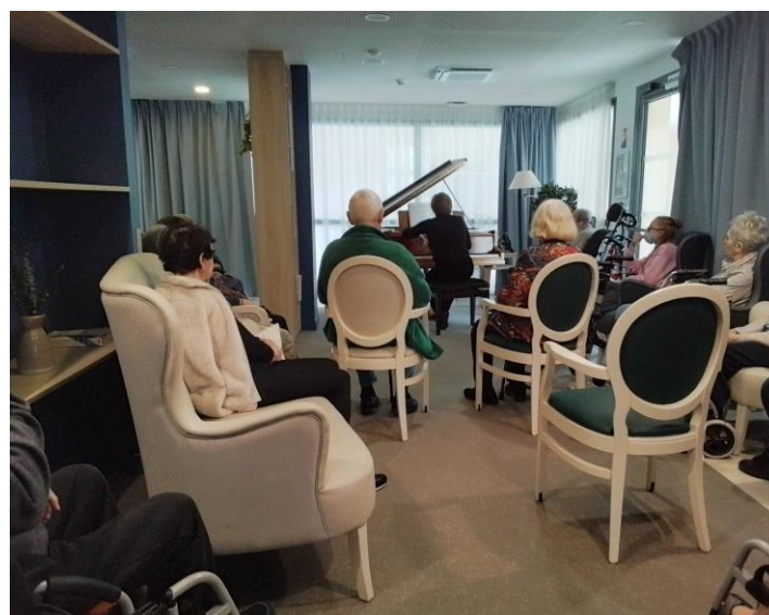
Le récital au salon Rabelais